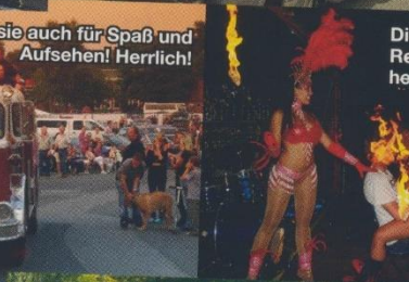
Neben Lärm sorgten sie auch für Spaß und Aufsehen! Herrlich!