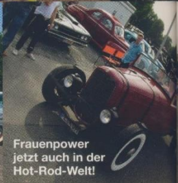
Frauenpower jetzt auch in der Hot-Rod-Welt!