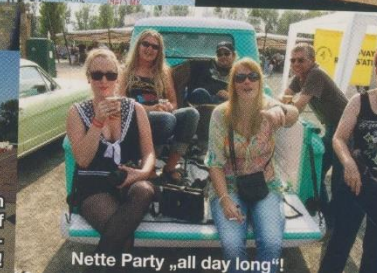
Nette Party „all day long“!