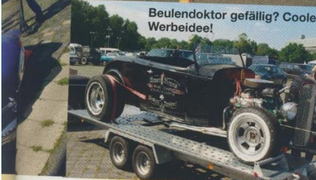
Beulendoktor gefällig? Coole Werbeidee!