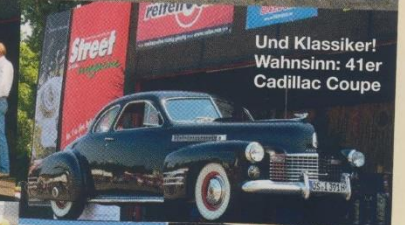
Und Klassiker! Wahnsinn: 41er Cadillac Coupe