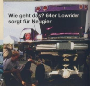
Wie geht das? 64er Lowrider sorgt für Neugier