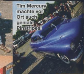
Tim Mercury machte vor Ort auch geniale Pinstripes!