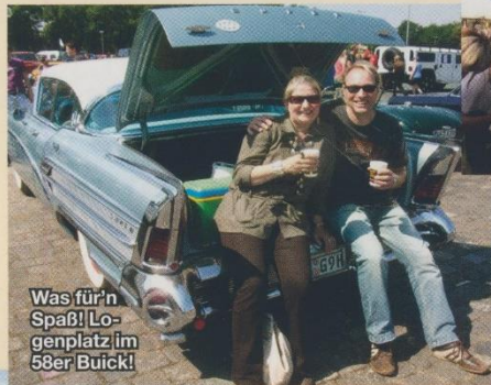
Was für'n Spaß! Logenplatz im 58er Buick!

perfekt mit der Harley-Party in der Stadtmitte ergänzte. Viele interne Club Meetings haben in Hannover stattgefunden.