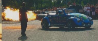
Devil Girl! Ihr müsstet mal ihre E-Mail-Adresse kennen! Stephanies 61er DeSoto