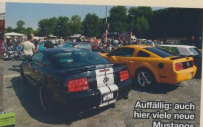
Auffällig: auch hier viele neue Mustangs