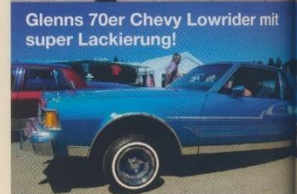
Glenns 70er Chevy Lowrider mit super Lackierung!