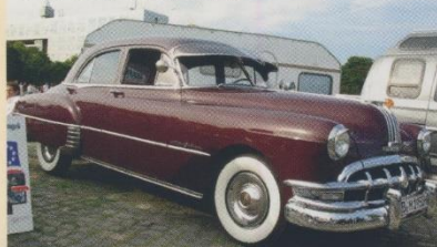
Immer wieder viele Klassiker: 50er Pontiac