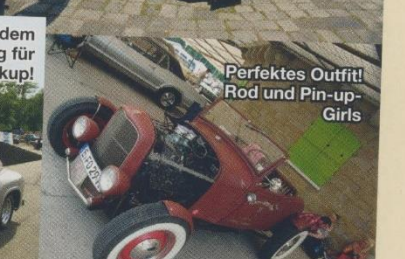
Perfektes Outfit! Rod und Pin-up-Girls