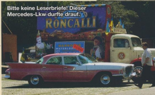
Bitte keine Leserbrief! Dieser Mercedes-Lkw durfte drauf.