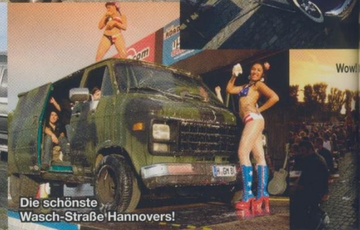
Die schönste Wasch-Straße Hannovers!