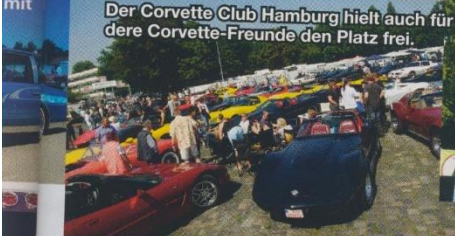
Der Corvette Club Hamburg hielt auch für andere Corvette-Freunde den Platz frei.