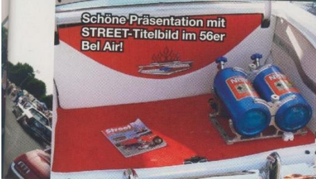
Schöne Präsentation mit STREET-Titelbild im 56er Bel Air!