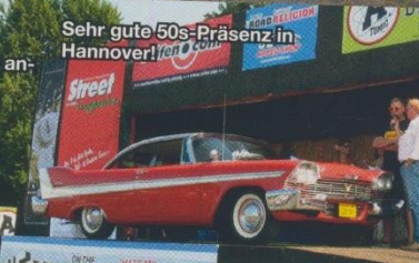
Sehr gute 50s-Präsenz in Hannover!