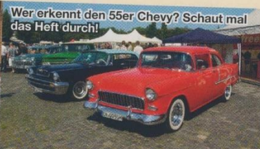
Wer erkennt den 55er Chevy? Schaut mal das Heft durch!