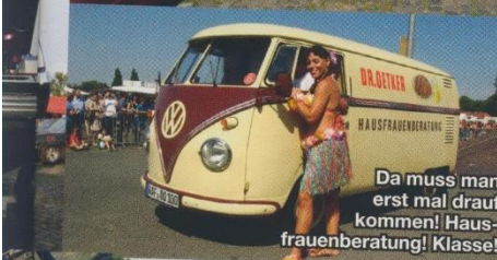
Da muss man erst mal drauf kommen! Hausfrauenberatung! Klasse!