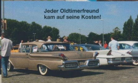
Jeder Oldtimerfreund kam auf seine Kosten!